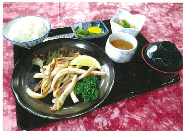
スルメイカの炙りとライスセット