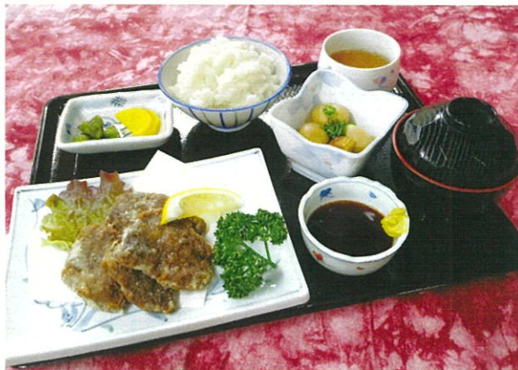
クジラ竜田揚げとライスセット