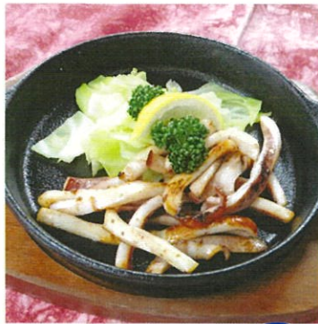
スルメイカの炙り