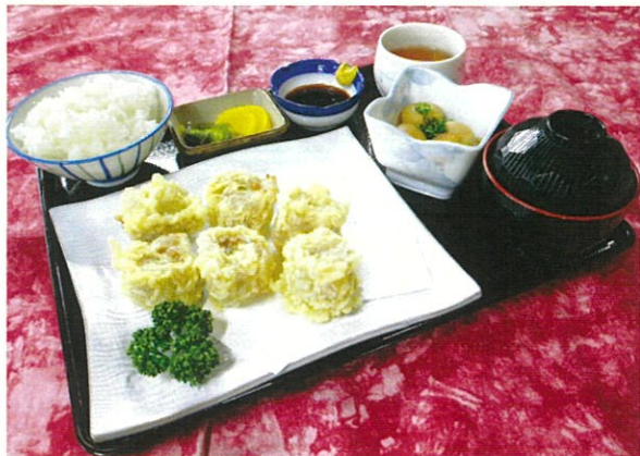
揚げシューマイとライスセット