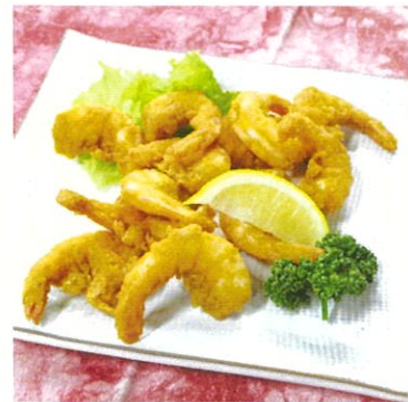
ガーリックシュリンプ