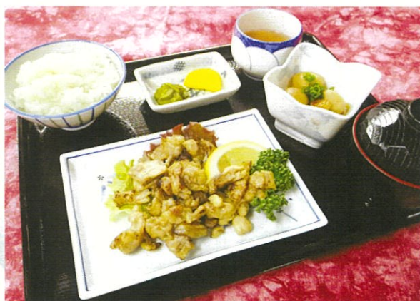
鶏ハラミの炭火焼とライスセット