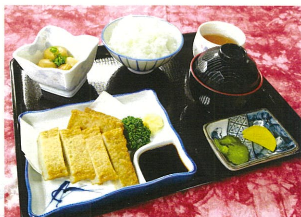
じゃこ天麩羅とライスセット