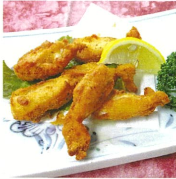
ヤゲン軟骨の唐揚